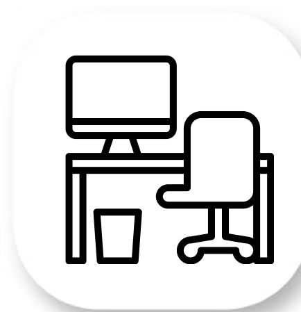
Location de Bureau